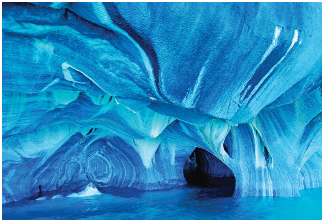
La Catedral de Mármol es una hermosa formación mineral de carbonato de calcio ubicada sobre las orillas del lago General Carrera.