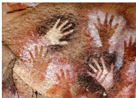
La Cueva de las Manos es el mayor vestigio de arte rupestre de Sudamérica. Las pinturas tienen 9000 años de antigüedad y se ubican en la provincia de Chubut, Argentina.